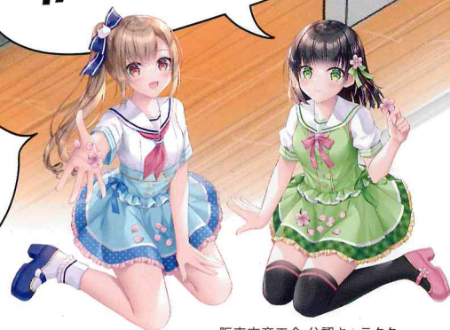
阪南市商工会 公認キャラクター 波有手 美海&緑川さくら